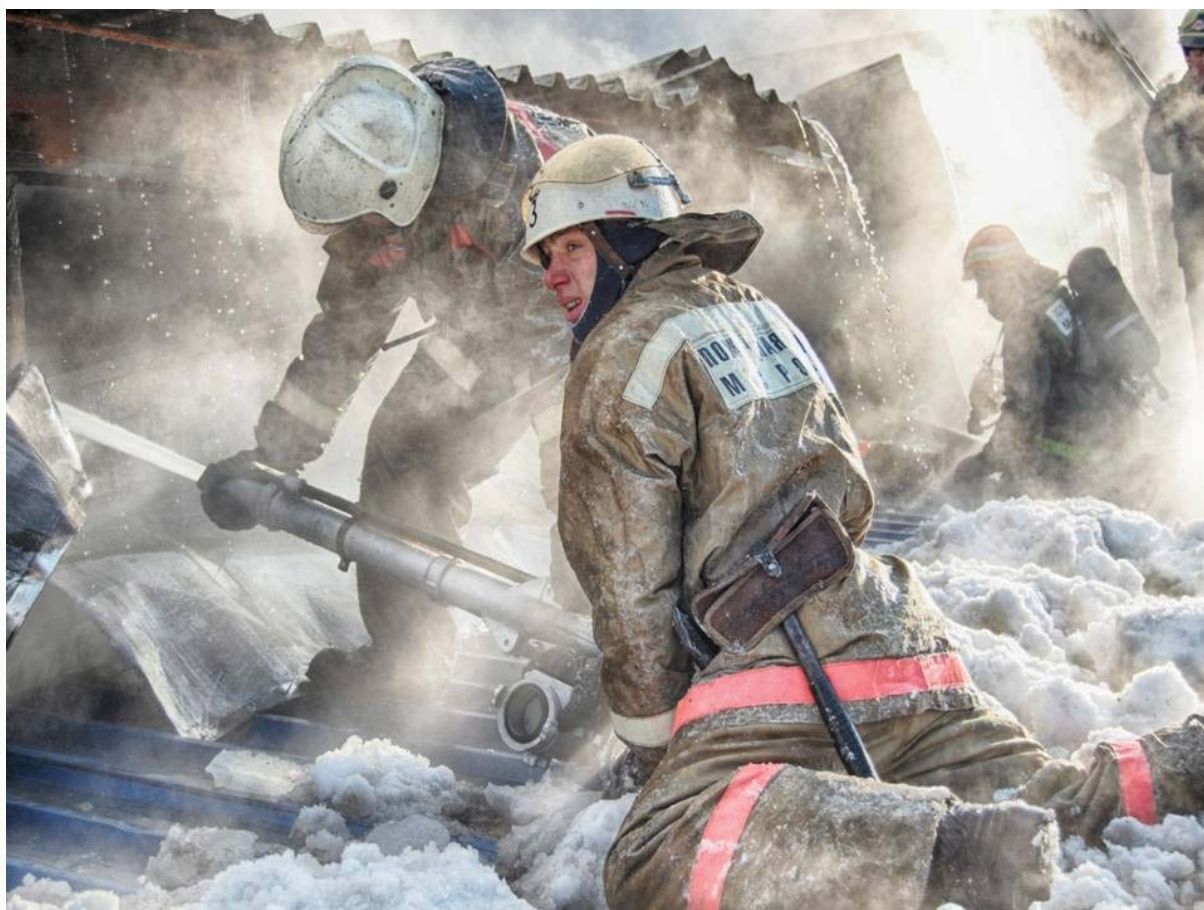
Рис. 3. Трудовые будни огнеборцев

Так как пожар – одна из самых значимых катастроф для человечества, то особое внимание уделяется развитию профилактических мер. Вся работа в направлении пожарной профилактики подчинена главной цели – снижению риска числа пожаров, устранению негативных факторов, способствующих его развитию, ограничению последствий, то есть ликвидации с минимальными людскими и материальными потерями.