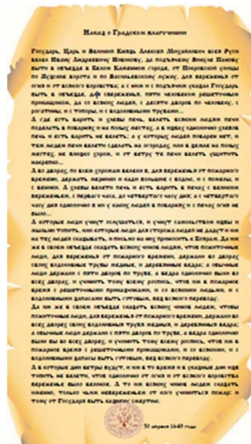
Рис. 1. Глава 1 «Соборного Уложения» Рис. 2. Наказ о градском благочинии

Неоценим вклад в область борьбы с пожарами Петра I. Он, как и все его предшественники, старался уделить особое внимание развитию профилактических мер по предупреждению огненной стихии. В годы его правления издается указ о начале строительства домов из камня или мазанки, при Адмиралтействе создается подобие специализированной пожарной команды и первого пожарного депо, из-за границы ввозятся двухцилиндровые поршневые насосы с кожаными рукавами и медными брандспойтами.