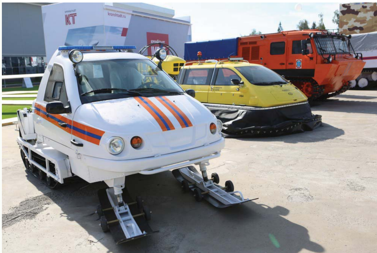
Рис. 2. Уличная экспозиция МЧС России

В том числе был организован стенд Центра экстренной психологической помощи МЧС России и уличная экспозиция перспективных транспортных средств в интересах МЧС России.