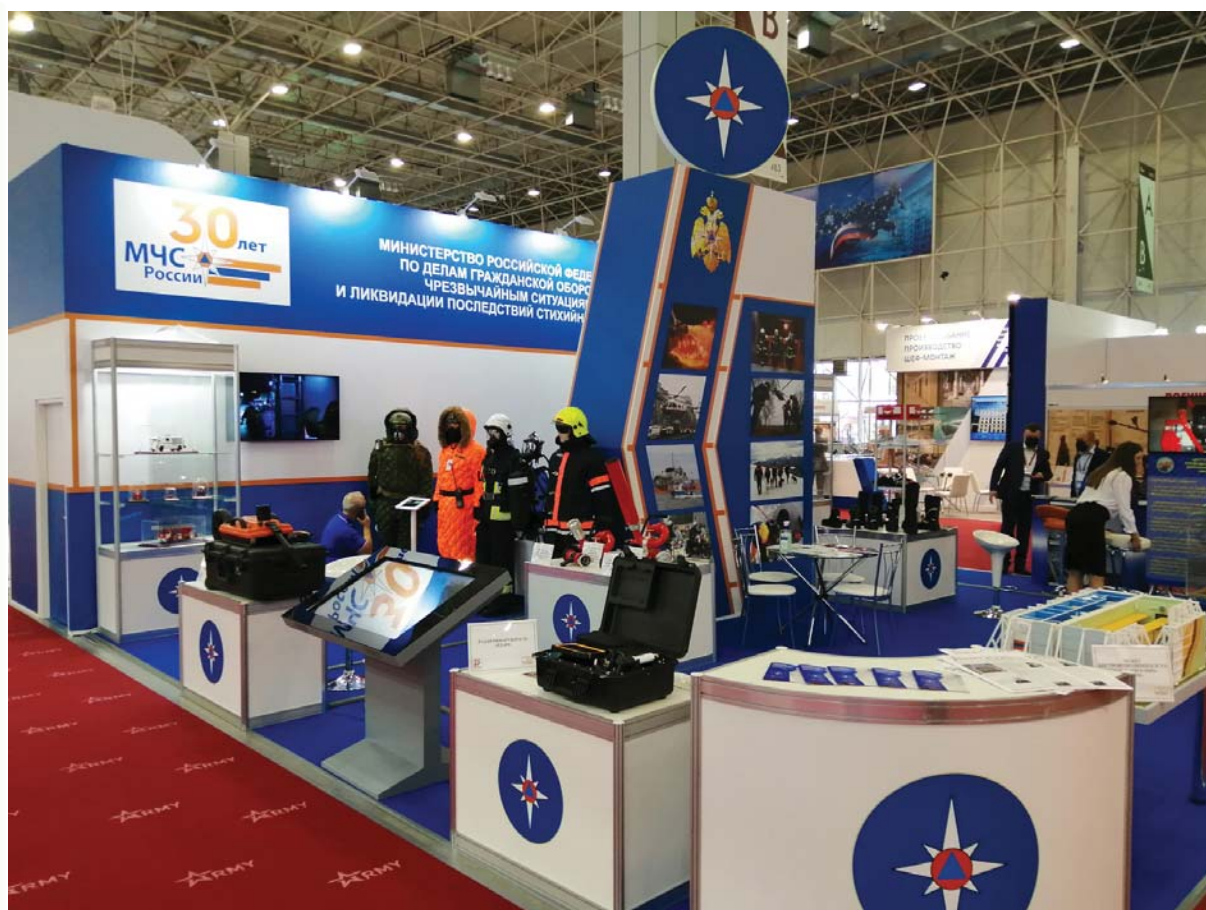
Рис. 1. Центральная экспозиция МЧС России

В том числе был организован стенд Центра экстренной психологической помощи МЧС России и уличная экспозиция перспективных транспортных средств в интересах МЧС России.